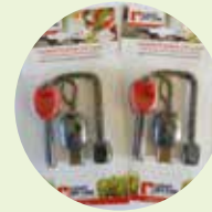
Feuersteine Verleih GRATIS