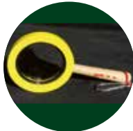
Holzlupen mit Etiketten