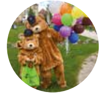
Bärenkostüm Verleih gegen Gebühr

Die Verleihgegenstände könnt Ihr im Rahmen Eurer Veranstaltungen für den Schwäbischen Albverein e.V. einsetzen. Wir versenden die Artikel (es fällt eine Versandkostenpauschale an) oder Ihr holt Sie direkt in unserem „Lädle“ in Stuttgart ab. Eine vorherige Terminabsprache und Reservierung ist Voraussetzung.