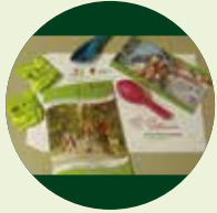
Willkommensmappen Zum selbst Befüllen für interessierte Familien, zum Download GRATIS

Wir bieten eine Vielzahl an kostenfreiem Service- und Infomaterial an, alle Infos findet Ihr hier: familien.albverein.net/service/ . Unser vollständiges (kostenpflichtiges) Werbematerial findet Ihr unter albverein-shop.de/familien-im-albverein . Jede gemeldete Jugend- und Familiengruppe erhält pro Kalenderjahr einen Freibetrag für unsere Werbeartikel (inkl. Porto).