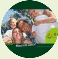
Mitgliedsanträge für Familien GRATIS