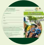
Kinderpass „ALBärtSpaß“ Erlebniskarte für junge Entdecker GRATIS